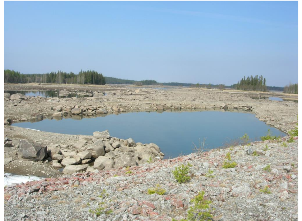
Regleringsamplitud – en utmaning